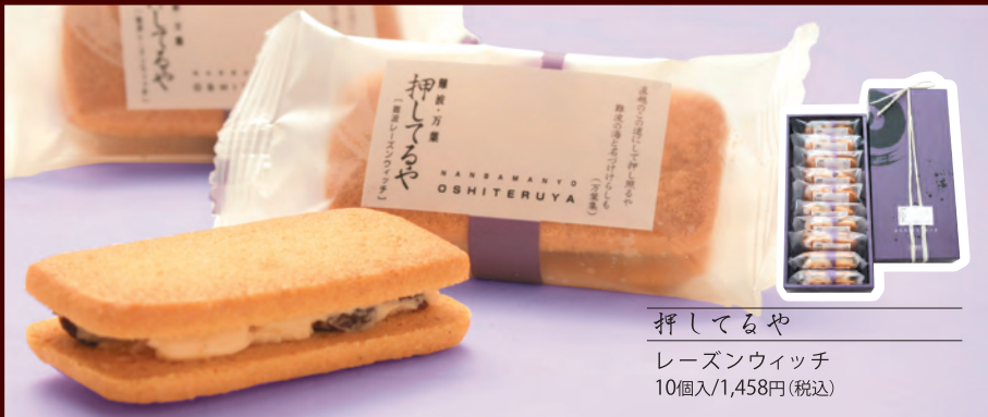
押してるや レーズンウィッチ 10個入/1,458円(税込)