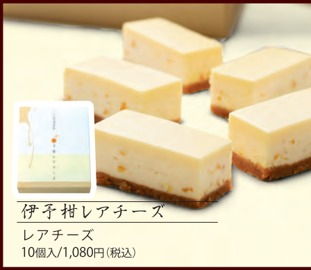
伊予柑レアチーズ レアチーズ 10個入/1,080円(税込)