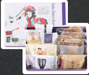
菓一度 sizeM 焼菓子・クッキー詰め合せ 2,160円(税込)