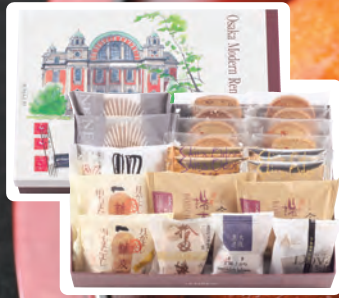
菓一度 sizeL 焼菓子・クッキー詰め合せ 3,240円(税込)