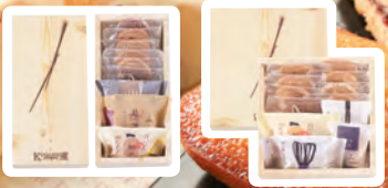
菓一度 焼菓子・クッキー詰め合せ SS/1,080円(税込) S/1,512円(税込)