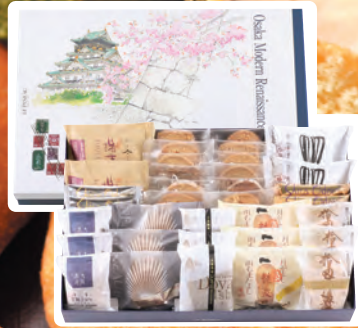
菓一度 sizeLL 焼菓子・クッキー詰め合せ 5,400円(税込)