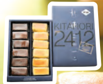
ガトースフレ北堀2412 スフレフロマージュ・スフレショコラ 12個入(各6個)/1,188円(税込)