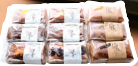
一の焼・焼ろるる パウンドケーキ バターロールケーキ 1本入り/918円(税込)～